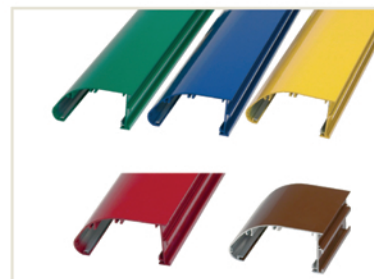
Laquage époxy toutes teintes RAL