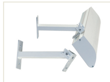
Bras de fixation orientable 200 et 400 mm - 2 points de fixation