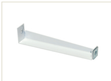
Bras de 330 mm renforcé