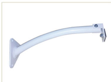
Bras design coudé - Lg : 350 mm orientable - 3 points de fixation