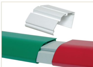
Pièce de raccordement des profilés