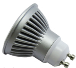
Spot leds 5 W