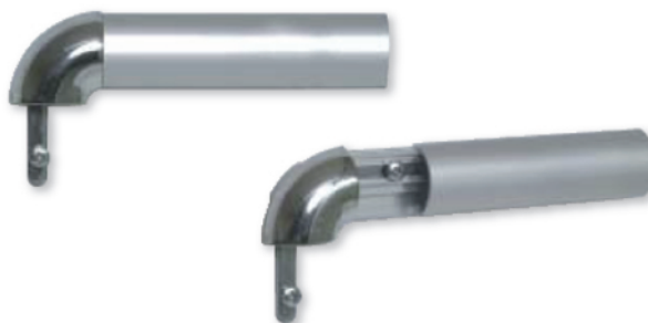
Profilé 32 mm