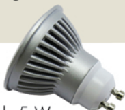
Spot leds 5 W