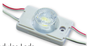
Modules Leds périphériques 1,32 W