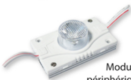
Modules Leds périphériques 3 W