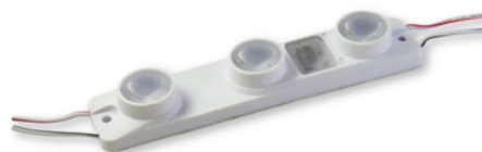
Leds périphérique 3 x 2 W LG (780 lm)