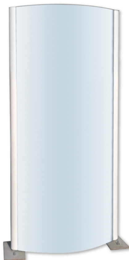
Mini Totem face plane non lumineux