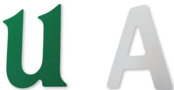
Face aluminium découpée 2 ou 3 mm.