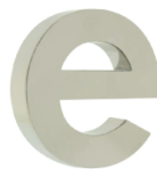
Inox poli miroir