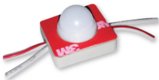
Led grand angle type SMD