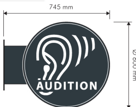
Modules Leds périphériques 1,32 W