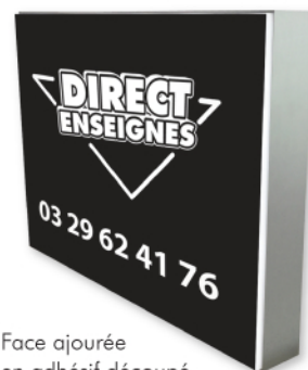
Face ajourée en adhésif découpé