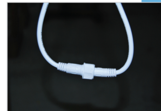
Connecteurs rapides étanches (compris)

Couleurs : rouge, jaune orangé, vert, bleu, blanc