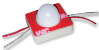
Led grand angle type SMD