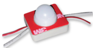
Led grand angle type SMD