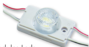
Modules Leds périphériques 1,32 W