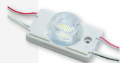
Modules Leds périphériques 1,32 W