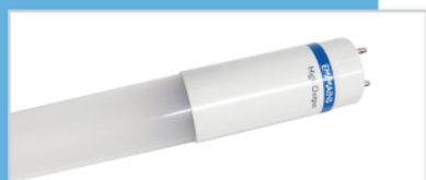
Tubes Leds Philips blanc chaud 4000°k